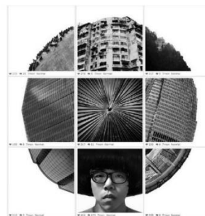
Ng Wei jiang (@ Orhganic) Collage digital

« Le scrabble, 1 er jan 1983 », collage photographique, 1983