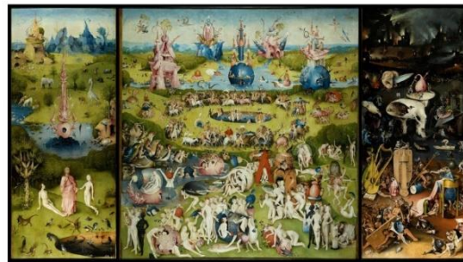
Jérôme BOSCH (1450-1516)

« La Création du monde » et « Le Jardin des délices » v.1505