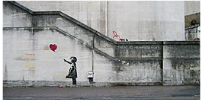
Banksy, Girl with balloon , pont de Waterloo, South Bank, Londres, 2002.

https://www.youtube.com/watch?v=hFCq4NWrN4A (1min02)