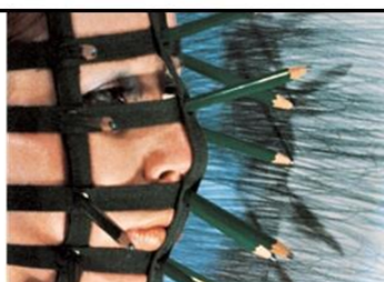
Rebecca Horn « Le masque aux crayons » 1972