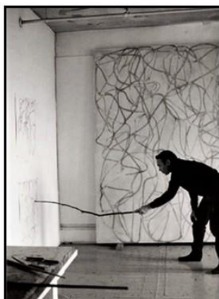
Brice Marden dessinant avec un bâton dans son atelier

D'autres artistes ont eux aussi dessiner avec des outils inhabituels, quitte à en créer de nouveaux. En voici quelques exemples: